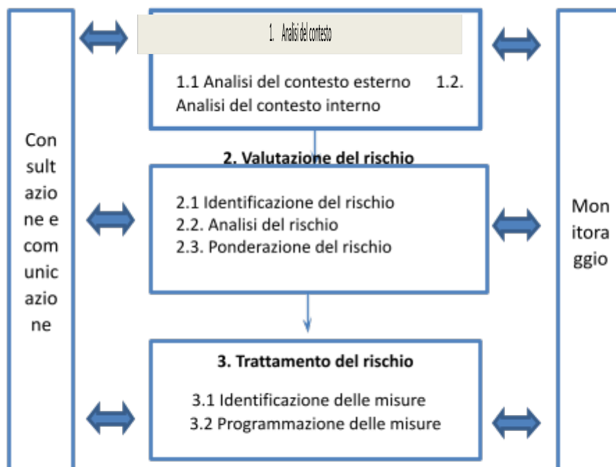
Figura 1 - Il processo di gestione del rischio di corruzione

La gestione del rischio di corruzione è lo strumento da utilizzare per la riduzione delle probabilità che il rischio si verifichi e la pianificazione, mediante l'adozione del P.T.P.C., è il mezzo per attuare la gestione del rischio, le cui fasi principali da seguire sono: