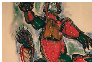
Mario Merz. Pageantry of painting. Corteo della pittura