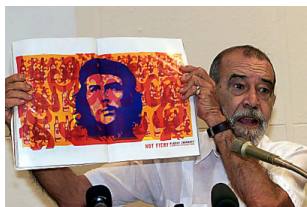
"Che Guervara", le foto di Alberto Korda in mostra a Bologna