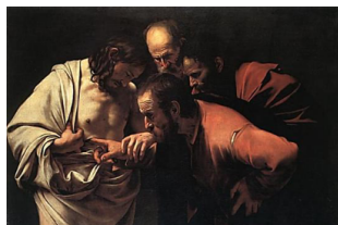
La resurrezione nell'arte: i dipinti più famosi sulla Pasqua