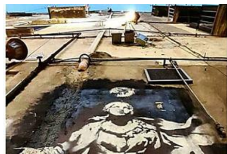
Banksy, una teca per proteggere il murale a Napoli

Passa a FIBRA a 29,90€ + 6 mesi di AMAZON PRIME con PRIME VIDEO inclusi