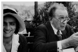
La casa e l'opera d'arte secondo Adolf Loos