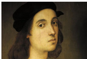
Pantheon a Roma: chi sono i personaggi illustri sepolti al suo interno