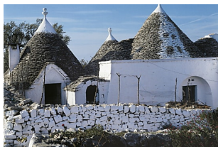
I trulli di Alberobello in Puglia: le informazioni per visitare il paese