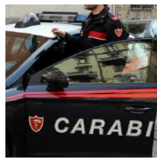
Identificati dai carabinieri colognesi

A seguito della denuncia sporta dalla vittima, un 15enne residente a Cologno, i militari della Tenenza di via Calamandrei avevano avviato le indagini, con l'obiettivo di risalire al branco composto da tre giovanissimi, coetanei dell'agredito. E a inizio settimana i carabinieri hanno chiuso il cerchio at-